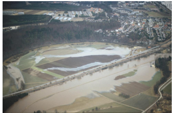
HW 1990 (ohne Einstau)